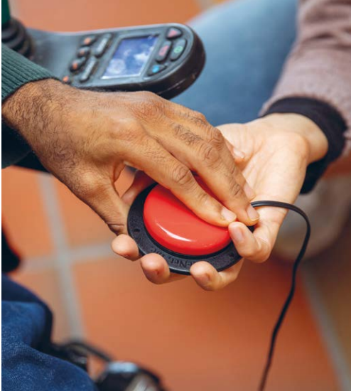
Die neue Informationsplattform kann zum Beispiel mit einem externen Taster bedient werden.

zur Arbeit oder in den Garten. Dann können sie jeweils selbst oder mithilfe ihrer Betreuungsperson etwas nachschauen, zum Beispiel, wann der Samichlaus kommen wird oder was die Weihnachtsfeier so alles verspricht. Vielleicht möchten sie auch herausfinden, wie lange es noch dauert, bis die leckeren Weihnachtsplätzchen auf den Wohngruppen gebacken werden oder wann mit dem Basteln der Weihnachtsgeschenke begonnen wird ... Die neue zentrale Informationsplattform wird für alle Menschen in der Sonnenhalde, wie auch für Besucherinnen und Besucher, eine echte Bereicherung sein.